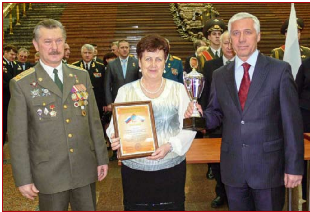
Вручение Почетной грамоты лучшему образовательному учреждению смотря-конкурса на «Кубок Героев»

В рамках этих проектов ежегодно организуются поездки для обучающихся спецшкол: