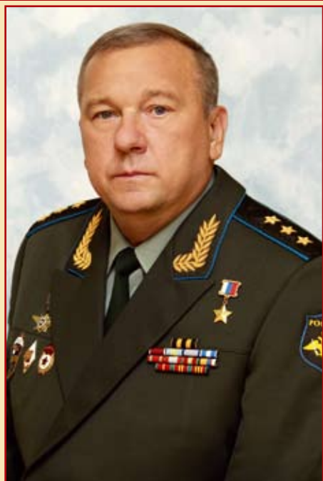
В.А. ШАМАНОВ Президент «Российской Ассоциации Героев» Герой Российской Федерации генерал-полковник