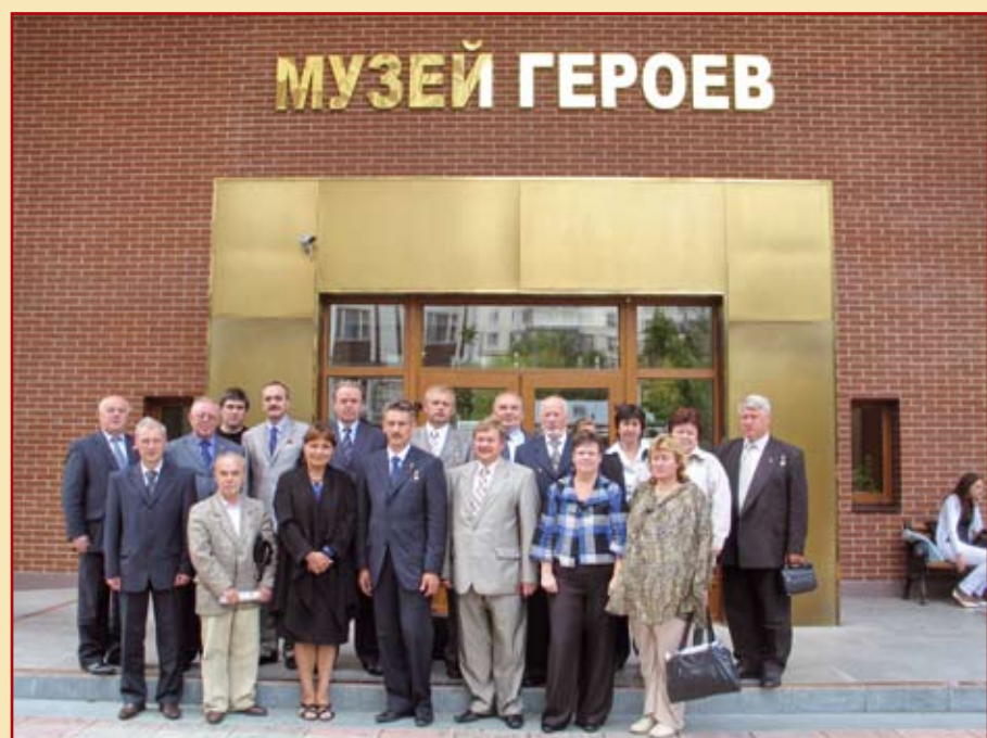
Герои – участники Фонда Героев имени генерала Е.Н. Кочешкова и представители общественных организаций города Москвы на мероприятии в Музее Героев Советского Союза и России.