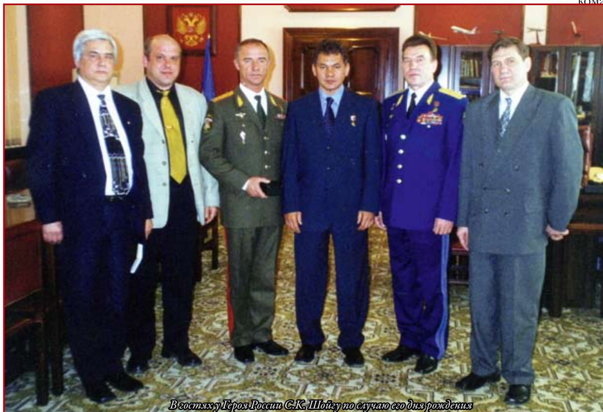
Вестяку Героя России С.К. Шойгу по случаю его дня рождения