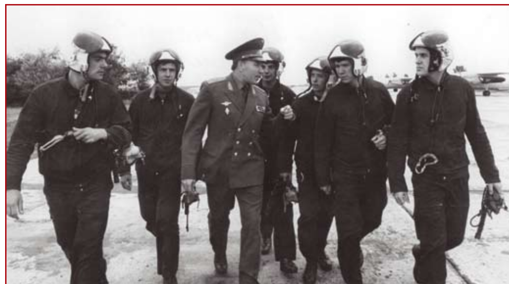
Апрель 1986 г. Чернигов. Аэродром