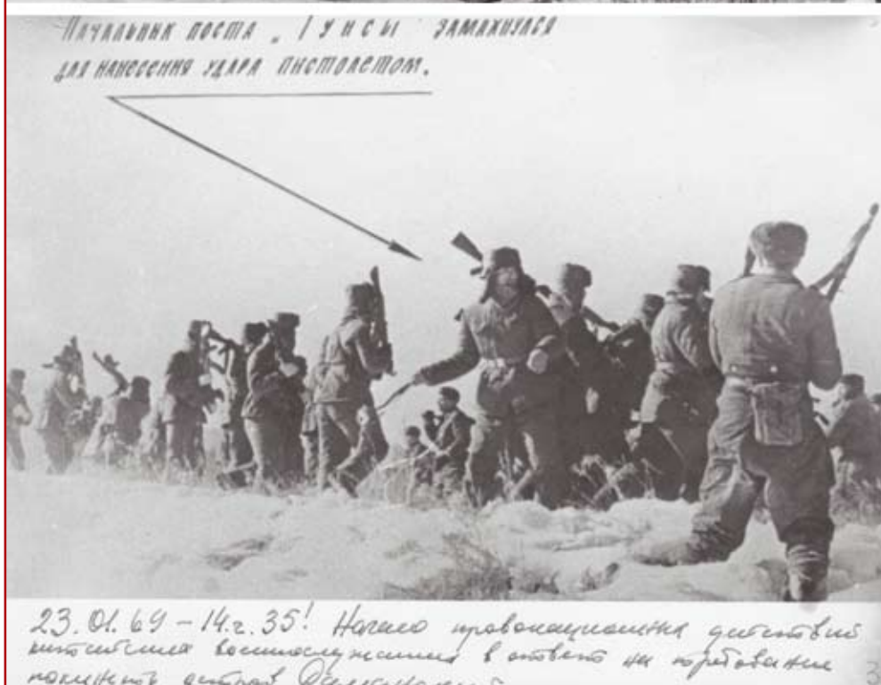
23 января 1969 г. провокация китайских военнослужащих погранпоста Гунсы под командованием начальника поста. Китайцы уже активно применяют оружие, а мы еще обороняемся дубинками

о своих территориальных притязаниях. Однако переговоры по редемаркации границы результата не принесли, и китайцы в одностороннем порядке вооруженным путем попытались решить эту проблему. Так бывает всегда: где нет политической воли, где преобладают личные амбиции – там льется кровь. История знает много таких поучительных примеров.