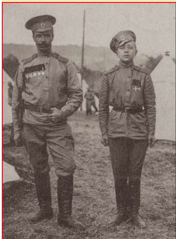
Юный доброволец Русского экспедиционного корпуса во Франции. 1916 г.