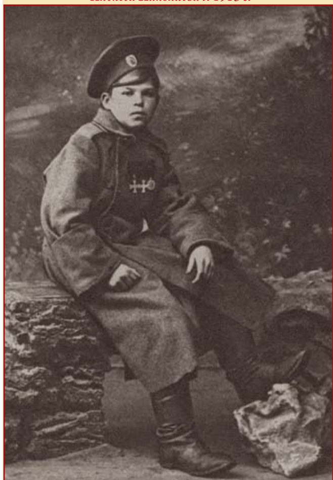
12-летний герой-разведчик Василий Наумов. 1915 г.