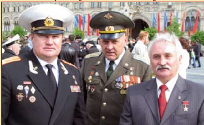
Герои Российской Федерации Вдовкин В.В., Полянский В.В. и Герой Советского Союза Солуянов А.П. после возложения цветов к Могиле Неизвестного солдата в День Победы