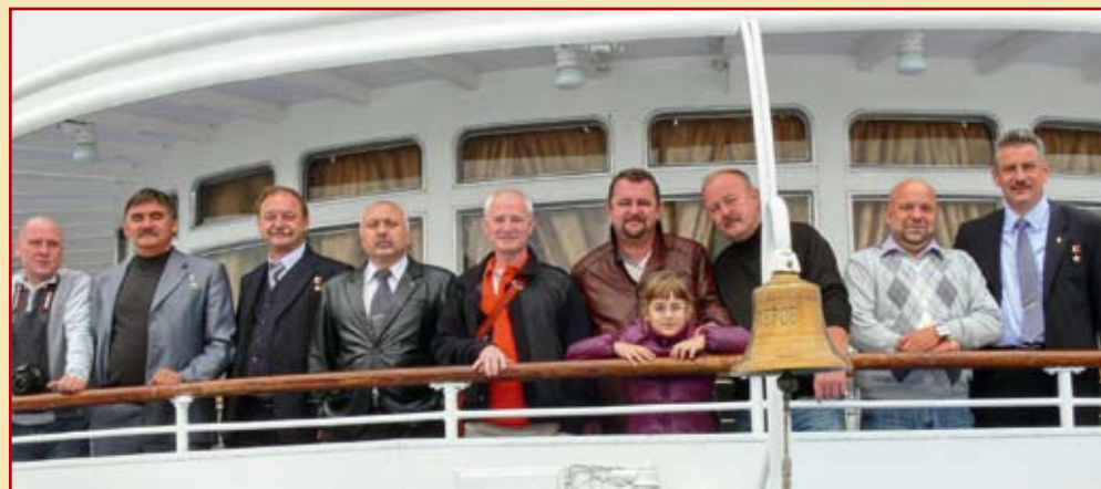
Особенно Героям по душе теплоходные поездки в День города.