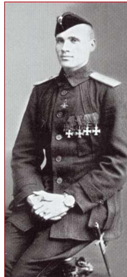
Военный летчик И.К. Ефремов Георгиевский кавалер всех 4-х степеней. Петроград. Август 1916 г.

30 декабря 1915 г. поручик Калашников командовал 23-м авиационным отрядом. Грамотный в военных науках, хорошо разбирающийся в вопросах тактики воздушных сражений, опытный и отважный боевой летчик, он погиб нелепо – во время служебной поездки потерпел аварию на мотоцикле и скончался на месте.