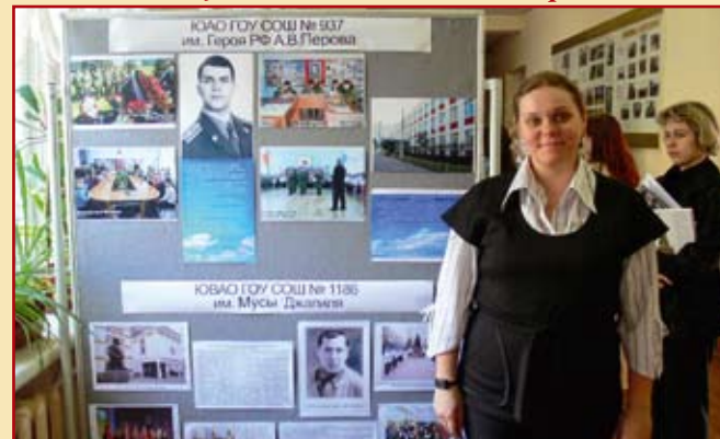
Слет представителей образовательных учреждений, носящих почетные наименования Героев Советского Союза и Героев России