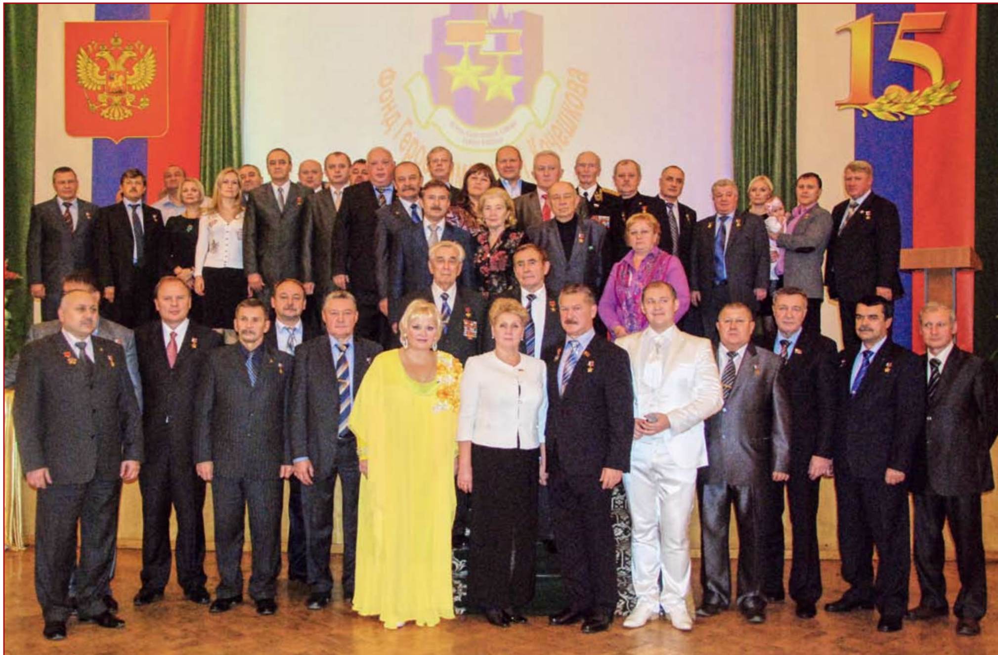
Участники торжественного мероприятия, посвященного 15-летию Фонда Героев имени Е.Н. Кочешкова

В последние годы Фонд Героев реализует крупные социальные проекты, такие как долгосрочная социально значимая благотворительная программа патриотического воспитания, физического и духовного развития молодежи и школьников г. Москвы «Равнение на Героев», которой был присвоен статус «Московской городской благотворительной программы», а также социально значимый проект «Социальная реабилитация детей с девиантным поведением специальных общеобразовательных школ через героико-патриотическое воспитание «Возьми в пример себе Героя», которая уже не первый год получает грант Президента РФ.