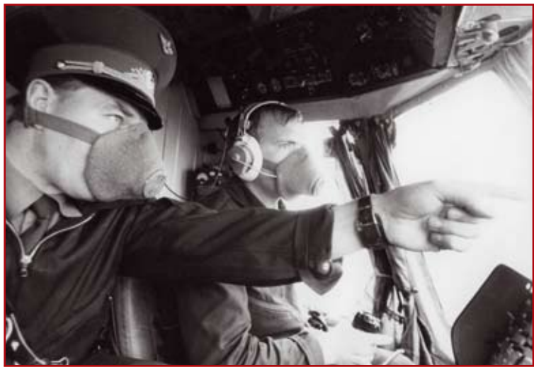
В районе реактора

Примерное отношение к службе и достойное рвение в выполнении служебных обязанностей не остались незамеченными. Через два года после выпуска, едва