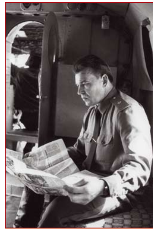
Июль 1986 г.