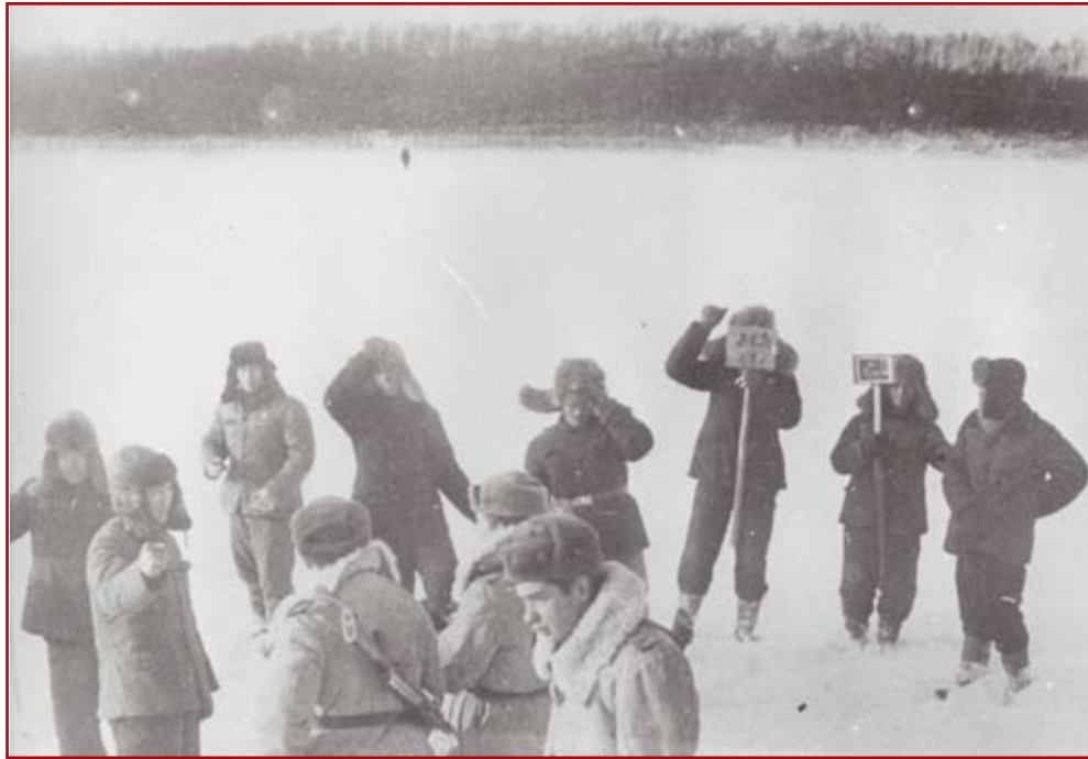
1968 г. (январь) о. Киркинский, участок 1-й погранзаставы. В провокациях уже принимают участие представители спецслужб и военнослужащие Китая

- Формальным поводом стал спор по поводу принадлежности острова – участка суши, площадью около полутора квадратных километров, отделенного от китайского берега протокой шириной метров 70. Остров безлюдный, и с какой стороны не смотри, хозяйственной или военно-стратегической ценности он не представлял. Китай считал остров своим, поскольку тот находился по его сторону от фарватера реки, а именно по нему традиционно проводят границы. Но в данном случае граница проходила по китайскому берегу Уссури. Ее охрана и осуществлялась в соответствии Пекинским договором 1860 г. Увы, его несовершенство аукнулось через сто с лишним лет. Но дело не только в топографии: на карту была поставлена большая политика: в 1960-е гг. между Китаем и Советским Союзом резко обострились противоречия политического, экономического и военного характера, и Пекин официально и объявил