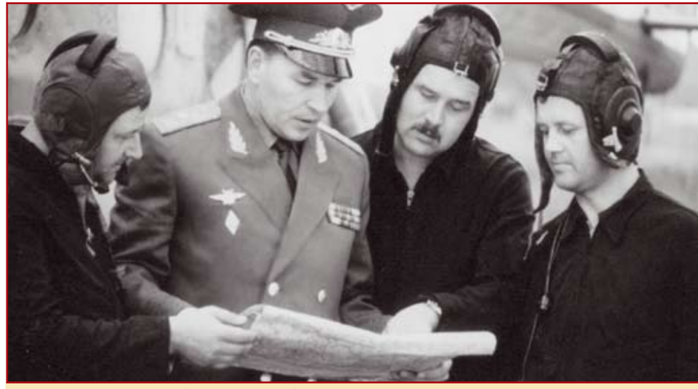
Утро 26 апреля 1986 г. Первый экипаж вертолетчиков.

28 апреля за счет ускорения погрузки вертолетов, сброса мешков, применения различных приспособлений (вроде опрокидывающихся ящиков, подвесных ковшей-грейдеров) удалось засыпать 90