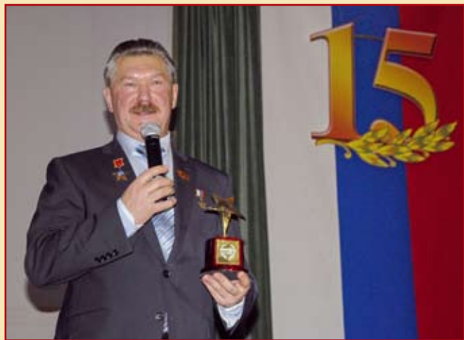
Президент Фонда Героев, Герой Российской Федерации Сивко Вячеслав Владимирович