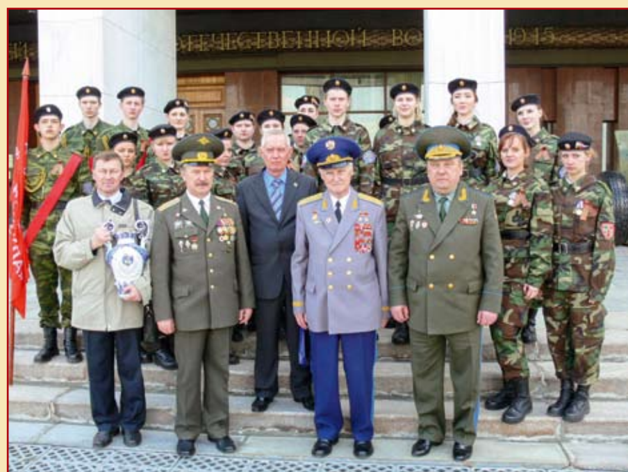
Руководители Ассоциации Героев с курсантами военно-патриотических клубов после вручения «Кубка Героев».