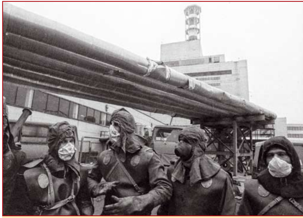
Конец ноября 1986 г. После установки саркофага

Для выполнения работ по локализации взорвавшегося блока на Чернобыльской АЭС была оперативно создана сводная авиационная группа в составе более 80 вертолетов и самолетов. Командование направляло в Чернобыль лучших