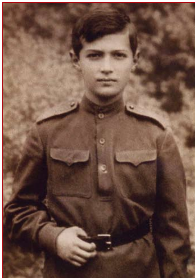
Наследник-цесаревич и великий князь Алексей Николаевич. 1915 г.

чи, Краснодона, Москвы и Сталинграда, дети-разведчики и морские пехотинцы, артиллеристы и снайперы, партизаны и сыновья полков. Принадлежат разным поколениям XIX–XX вв., они приходились друг другу – внуками, сыновьями и отцами, дедами и прадедами, оставаясь в памяти народа – маленькими героями, смелыми орлятами, заступниками Земли Русской!