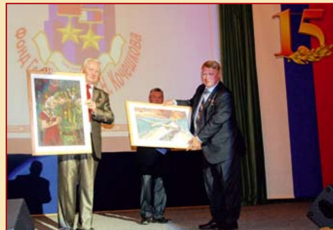
Вручение картин, выполненных учащимися ГБОУ Детской художественной школы «Солнцево», в подарок Фонду Героев.