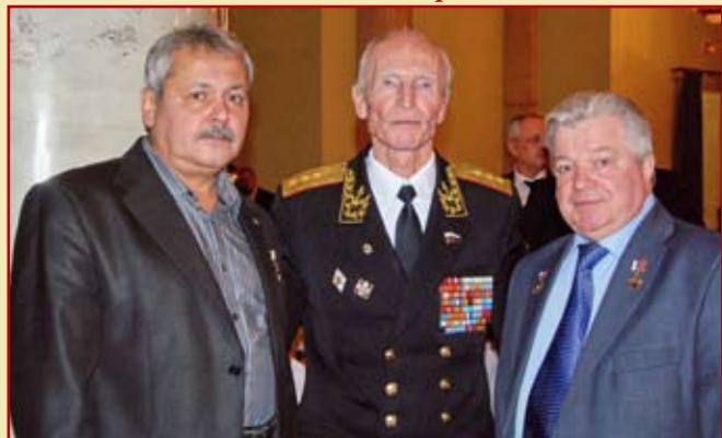
Герой Российской Федерации Уразаев И.К., генерал-полковник Скуратов И.С. и Герой Российской Федерации Новиков А.И. на торжественном мероприятии