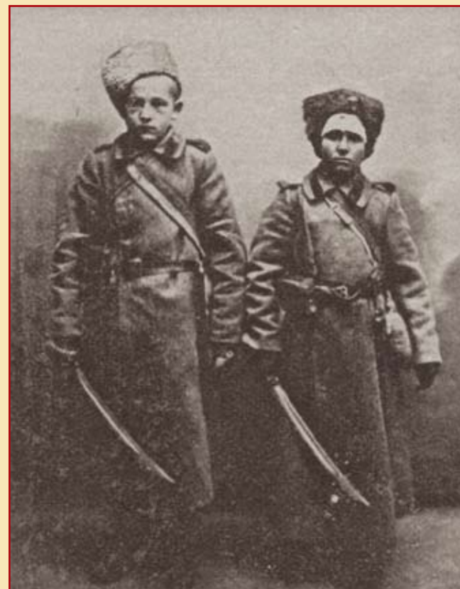
16-летние герои из Варшавы и Бессарабии. Из лазарета – на фронт! 1915 г.