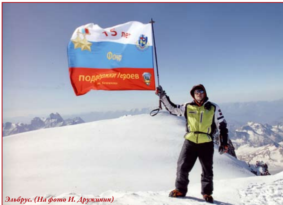
Эльбрус.